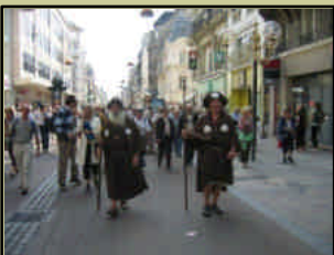
Photo Fête de St-Jacques 2007

Le n°25 devrait paraître en octobre et il contiendra entre autres, le dossier préparatoire à l'A.G.