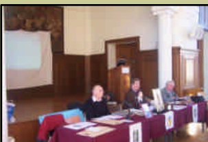
Dernière A.G. en février 2008