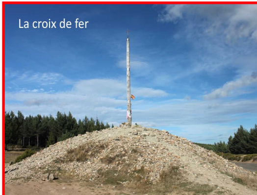
La croix de fer

Un poteau de 5 m de haut surmonté d'une grande croix en fer situé au sommet d'un monticule de terre et de pierres.